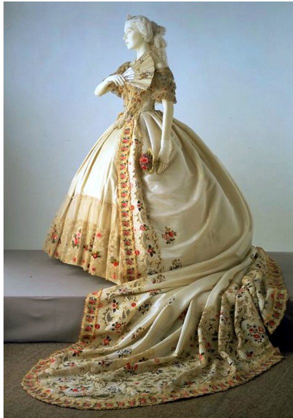
Over: Kjole for bruk ved hoffet.

Dette var den perioden i viktariatiden hvor skjørtene nådde sin største vidde. Skjørtene kunne være 5 meter i omkrets nederst. Det sier seg selv at det ikke var enkelt å bevege seg rundt i disse kjolene selv på den tiden. Med de mulighetene vi har med lokaler lar det seg simpelthen ikke gjøre å ha skjørtene på sitt helt fulleste. Det er viktig at du ikke kjøper (eventuelt lager) den aller største krinolinen som finnes, men holder deg innen det som står under 'skjørtene' avsnittet. Med andre ord, vi vil ha snittet på kjolen fra 1863 men en reduksjon i skjørtestørrelsen. Tenk skjørevidde anno 1855.